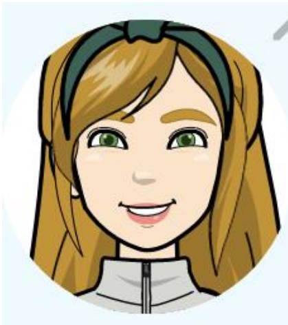
Avatar diseñado mediante la plataforma Pixton

Es una identidad virtual que escoge el usuario de una computadora o de un videojuego para que lo represente en una aplicación o sitio web diseñando una caricatura que busca tener una similitud con su aspecto físico y personalidad.